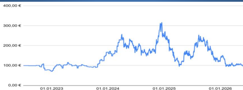
CHART - KURSENTWICKLUNG SCI1

*Vergangene Kursentwicklungen stellen keinen Indikator für zukünftige Kursentwicklungen dar