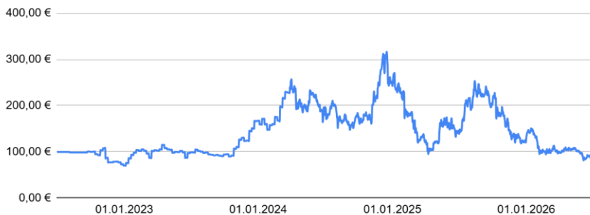
CHART - KURSENTWICKLUNG SCI1

*Vergangene Kursentwicklungen stellen keinen Indikator für zukünftige Kursentwicklungen dar **Der Zeitraum vom 24.06.2022 bis zum 30.08.2024 stellt eine Testphase mit reduziertem Handelsvolumen dar